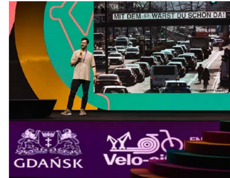
Große Bühne: Velo-city-Konferenz 2025 in Danzig.

JUN 10 JUN 13 Vom 10. bis zum 13. Juni fand in Danzig die Velo-city-Konferenz statt. Internationale Fachleute behandelten Themen wie aktive Mobilität, nachhaltige Stadtplanung sowie Radverkehr in Wirtschaft und Politik. Fachexkursionen mit dem Fahrrad gaben Einblicke in die Geschichte und Radverkehrspolitik der polnischen Gastgeberstadt. Ein Höhepunkt war die traditionelle Fahrradparade, bei der Tausende lokale Radfahrende und Konferenzteilnehmende gemeinsam durch die Straßen fuhren.