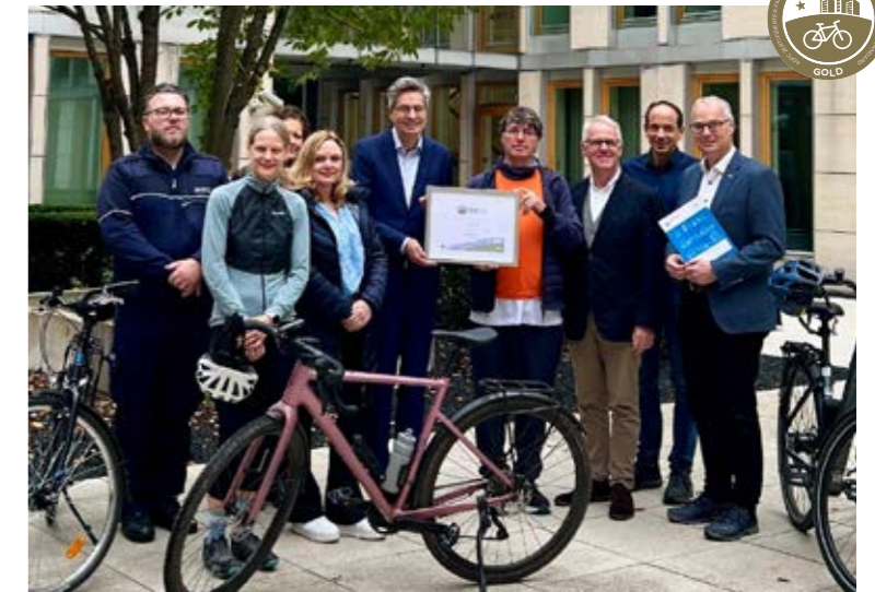
Das Oberlandesgericht Düsseldorf erhält das Gold-Zertifikat als Fahrradfreundlicher Arbeitgeber vom ADFC NRW – als erstes Gericht bundesweit.