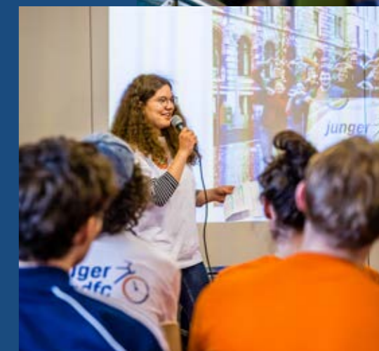
Der Junge ADFC startete mit einer Ideenwerkstatt, Workshops und der ersten Bundesjugendversammlung.