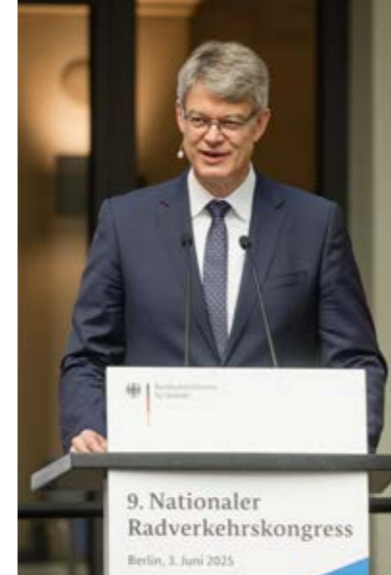
Bundesverkehrsminister Patrick Schnieder (CDU) auf dem Nationalen Radverkehrskongress.