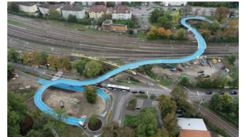
Positiv: Tübingen hat in den Radverkehr investiert und eine Fahrradbrücke gebaut.