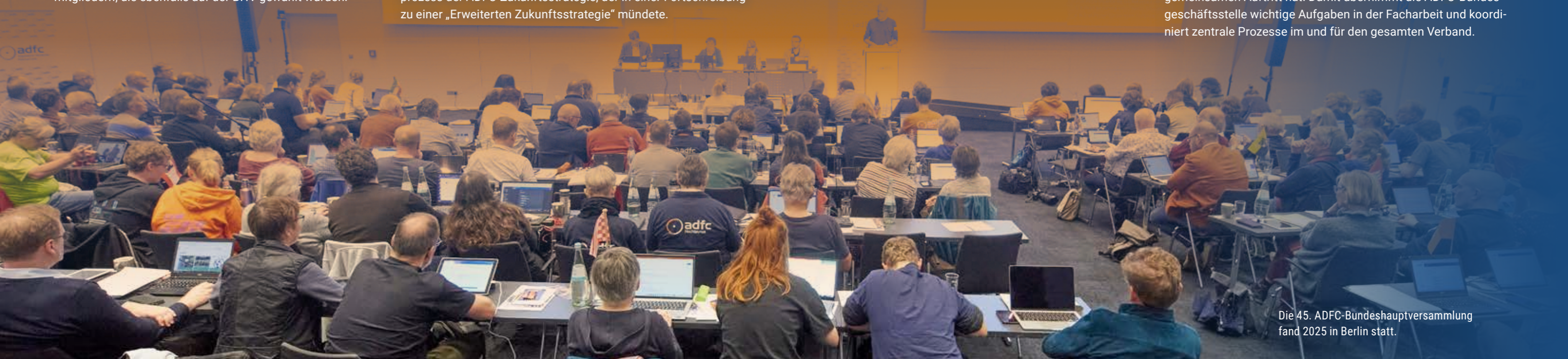
Die 45. ADFC-Bundeshauptversammlung fand 2025 in Berlin statt.

Die Bundesgeschäftsstelle schafft zudem Weiterbildungsangebote und Materialien für ehrenamtlich Aktive. Sie organisiert Foren und Veranstaltungen, unterstützt Organe und Gremien im Verband und sorgt dafür, dass der ADFC bundesweit einen starken gemeinsamen Auftritt hat. Damit übernimmt die ADFC-Bundesgeschäftsstelle wichtige Aufgaben in der Facharbeit und koordiniert zentrale Prozesse im und für den gesamten Verband.