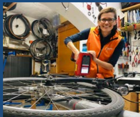
AGs liefern z. B. Know-how zur Codierung.